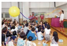
さと原人さんバルーンアートショー