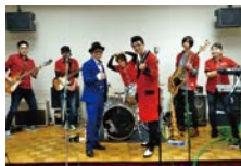
懐かしの60年代ポップス!