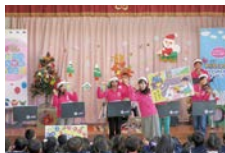
JAF 交通安全ドレミぐるーぷ